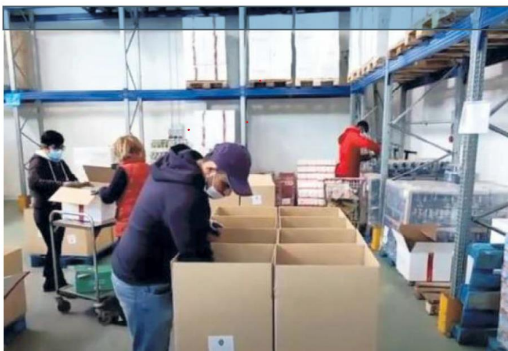
Nel magazzino dell'associazione Maria Madre della Provvidenza lavorano, a turno, quaranta volontari